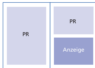
1 ½ Seite PR + ½ Seite Anzeige 175 mm x 257 mm + 175 mm x 122 mm